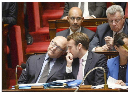
Michel Sapin et Emmanuel Macron, hier à l'Assemblée pour défendre le budget de la France.

Michel Sapin et Manuel Valls l'affirment. « Oui nous sommes dans les clous. Nous n'avons aucune raison d'être en contradiction », a assené le ministre des Finances avec fermeté. « Je ne parlerai jamais de mon pays comme vous venez de le faire »,