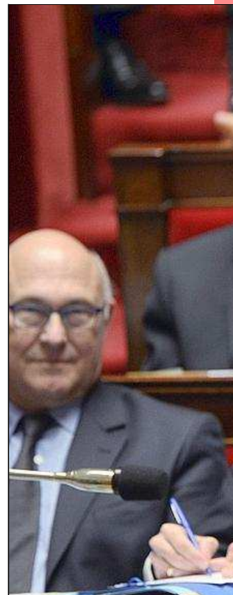
Aller au-delà est impossible, a déjà

La guerre du budget aura-t-elle lieu ? Elle n'ira sans doute pas jusqu'aux sanctions financières évoquées hier par l'opposition (voir ci-contre). Mais chacun devra bouger. La Commission européenne et l'Allemagne d'Angela Merkel, qui constatent les effets de l'austérité : le FMI revoit à la baisse ses prévisions de croissance en zone euro (à 1,3 % en 2015), et évoque un risque de « déflation » (baisse des prix entraînant une récession), qui deviendrait « le principal problème de l'économie mondiale ».