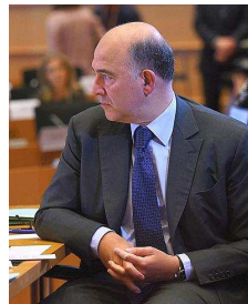
Pierre Moscovici.

La marche vers ce quasi-équilibre se fait sous surveillance permanente des États entre eux, et de la Commission européenne. Les gouvernements transmettent leur projet de budget à la Commission avant le 15 octobre. Celle-ci peut demander des modifica-