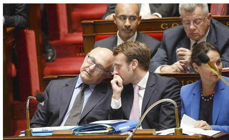
■ Michel Sapin et Emmanuel Macron, hier à l'Assemblée pour défendre le budget de la France.

Les centristes n'étaient pas plus tendres et ont interrogé le gouvernement lors de la séance des « Questions » avec