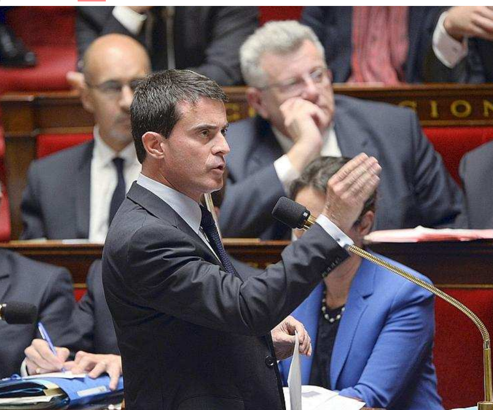
Premier ministre à la Commission européenne.