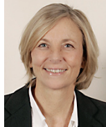
Marielle de Sarnez