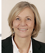
Marielle de Sarnez