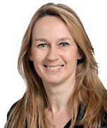
Constance Le Grip