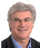
Patrick Le Hyaric