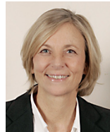
Marielle de Sarnez