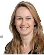
Constance Le Grip