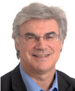
Patrick Le Hyaric