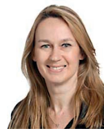
Constance Le Grip