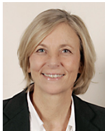
Marielle de Sarnez