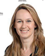
Constance Le Grip