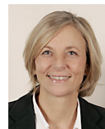
Marielle de Sarnez