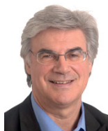
Patrick Le Hyaric