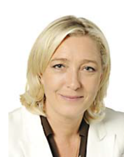
Marine Le Pen