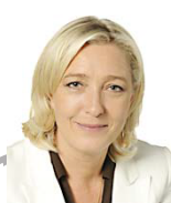
Marine Le Pen