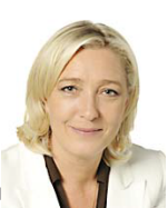
Marine Le Pen