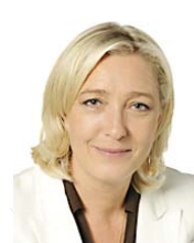
Marine Le Pen