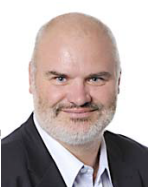
Front de Gauche