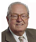
Jean-Marie Le Pen