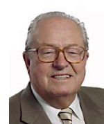
Jean-Marie Le Pen