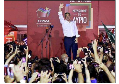
Alexis Tsipras salue ses partisans dimanche soir, à Athènes.