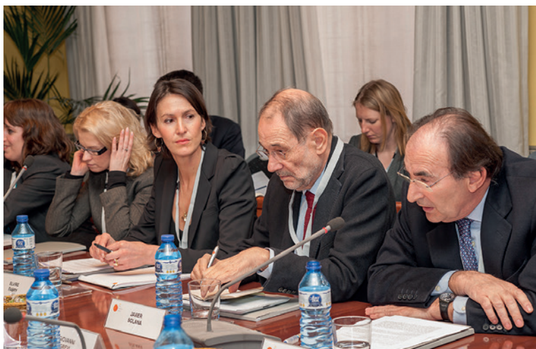
◀ Elvire Fabry et Javier Solana lors du séminaire « L'Union européenne : quel type d'acteur global ? », organisé par l'Institut Royal Elcano, Madrid, 25-26 février 2013.