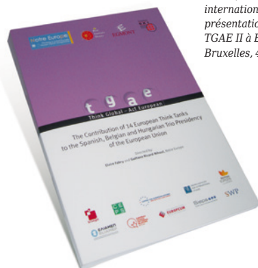
▲ Conférence internationale de présentation du rapport TGAEE II à Egmont II, Bruxelles, 4 mars 2010.