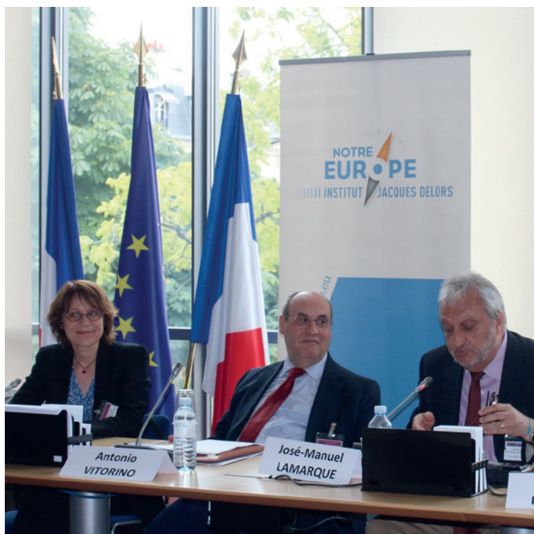
◀ Corinne Balleix, António Vitorino et José-Manuel Lamarque lors de la conférence « Le futur de la politique européenne d'immigration et d'asile : le Conseil européen répond-il aux défis ? » organisée en partenariat avec l'EPC, Paris, 27 juin 2014.