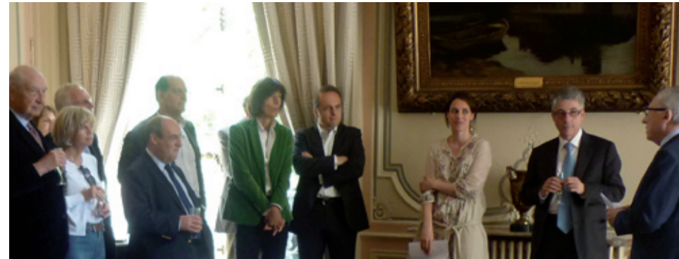
Conseil d'administration de Notre Europe – mai 2011 Notre Europe's Board of Directors – May 2011