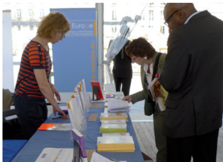
Stand d'information Notre Europe à la Fête de l'Europe, Paris – mai 2011 | Notre Europe's information stand at the Fête de l'Europe, Paris – May 2011