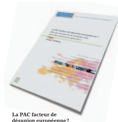
La PAC facteur de désunion européenne? Bilan des mécanismes de solidarité créés par la PAC et pertinence après 2013 | Is the CAP a ground for European disunion? An assessment of the solidarity mechanisms created by the CAP and their relevance after 2013 Nadège Chambon - juin 2011/June 2011