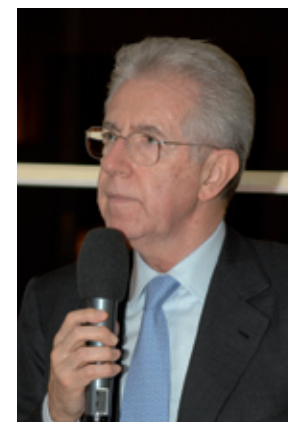
Mario Monti au dîner du Comité Notre Europe, Paris – novembre 2010 Mario Monti at the Notre Europe Committee, Paris – November 2010

Following the debates on November 13, all participating members signed a joint Declaration entitled "A new Resource of the European Budget". It was published in several European National newspaper: Le Figaro (France), The Financial Times (United Kingdom), Handesblatt (Germany), La Repubblica (Italy), Le Temps (Switzerland), Le Soir (Belgium), La Vanguardia (Spain).