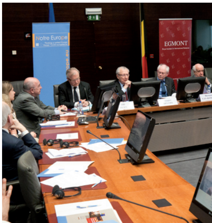
Séminaire d'experts en partenariat avec Egmont: « L'euro, les investisseurs et la gouvernance » en hommage à Tommaso Padoa-Schioppa, en présence de J. Almunia, O. Rehn, J. Delors, H. Van Rompuy et E. Davignon, Bruxelles - avril 2011 Seminar in partnership with Egmont: "The Euro, the investors and the governance" in honour of Tommaso Padoa-Schioppa, in the presence of J. Almunia, O. Rehn, J. Delors, H. Van Rompuy and E. Davignon, Brussels - April 2011