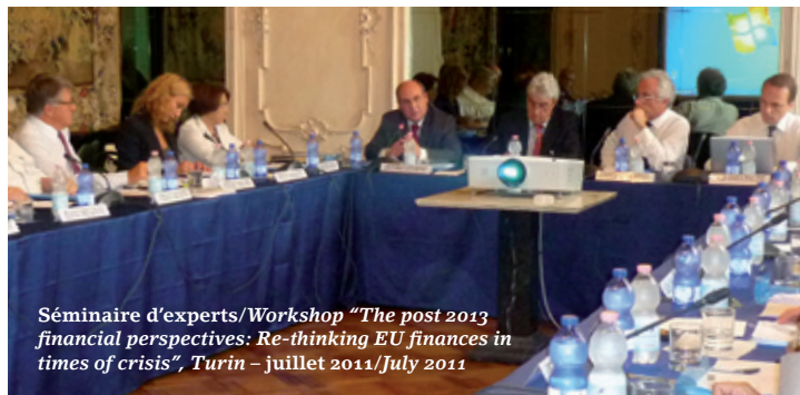
Séminaire d'experts/Workshop "The post 2013 financial perspectives: Re-thinking EU finances in times of crisis", Turin – juillet 2011/July 2011

Beyond research, an experts' seminar on the European budget was co-organised with Centro Studi sul Federalismo, European Policy Centre and Istituto Affari Internazionali in July 2011 in Turin, with the strategic partnership of the Compagnia di San Paolo.