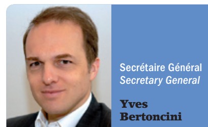
Secrétaire Général Secretary General