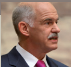
George Andr  as Papandreou

Premier Ministre Grec Greek Prime Minister