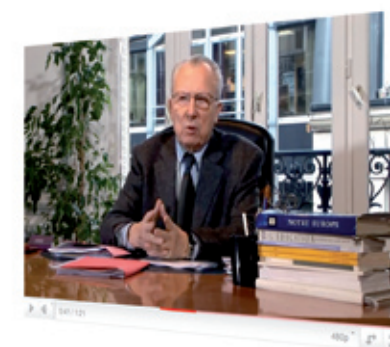
Film institutionnel de Notre Europe Notre Europe's Institutional movie

Notre Europe will also make more use of audiovisual supports in order to communicate on its activities. An institutional movie of Notre Europe was therefore realised and officially launched on January 2011.