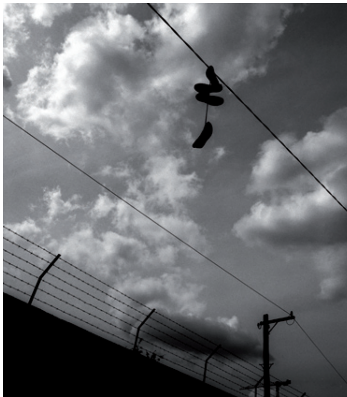
Photo issue du livre « Fabriques de l'Europe » Photo from the book «European Works» Dublin 2008 © Gilles Favier/Agence VU'