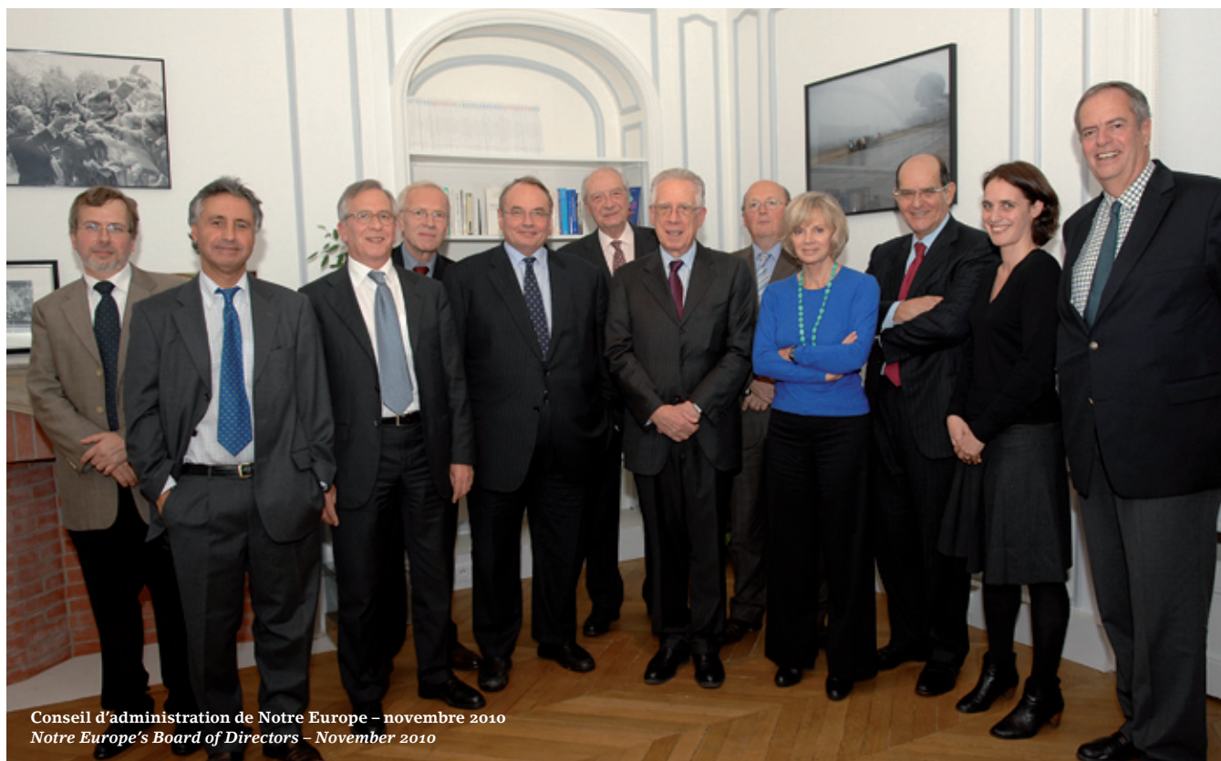
Conseil d'administration de Notre Europe – novembre 2010 Notre Europe's Board of Directors – November 2010

Professeur associé à Sciences Po et ancien député européen Associate Professor at the Sciences Po, Paris and former member of the European Parliament