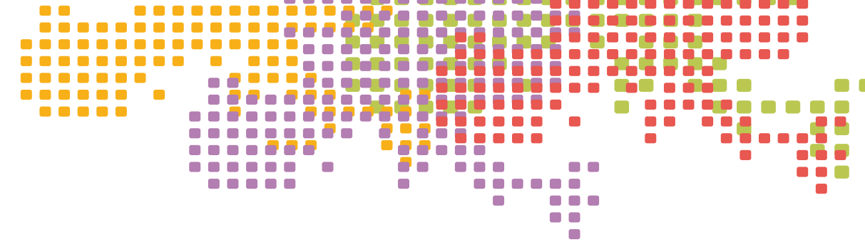
Travaux réalisés par Notre Europe en 2005 et en 2006

While meeting the highest standards of quality and academic rigour, our production grew in 2006. It was also diversified through the publication of books, "brefs" (four-page analyses and political recommendations directed at current issues), debates on the website and opinion articles published in the press.